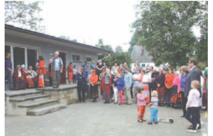
Iru külamaja avamine