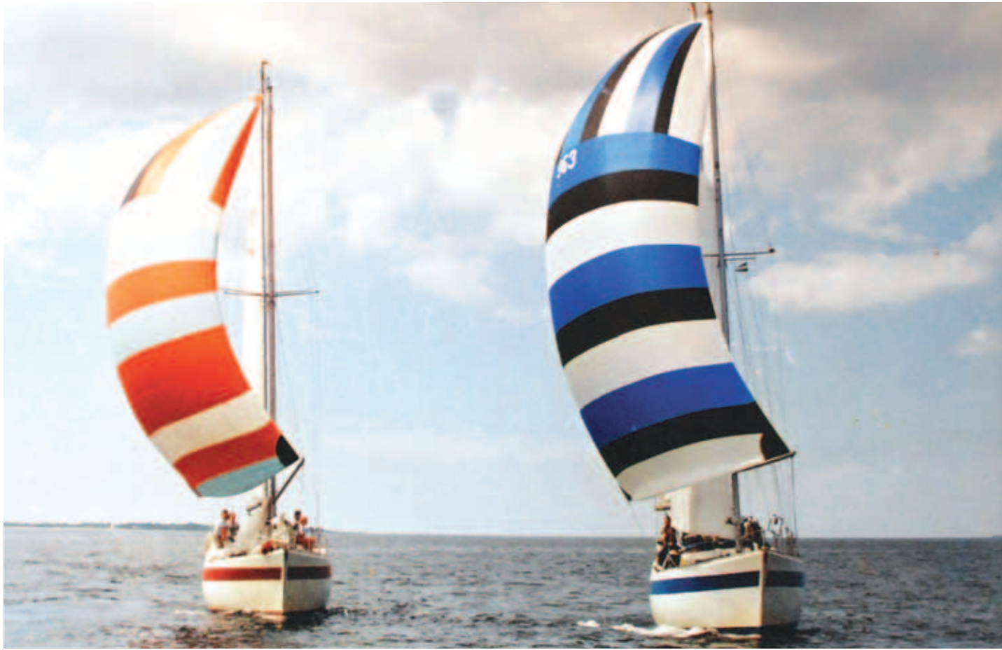
“Minna” (vasakul) seilamas Kalevi kommivabriku purjekaga “Edda”, mille sinimustvalge spinnakeri vastu võinuks kaheksakümnendate keskpaigas nii mõnigi ametnik huvi tunda.