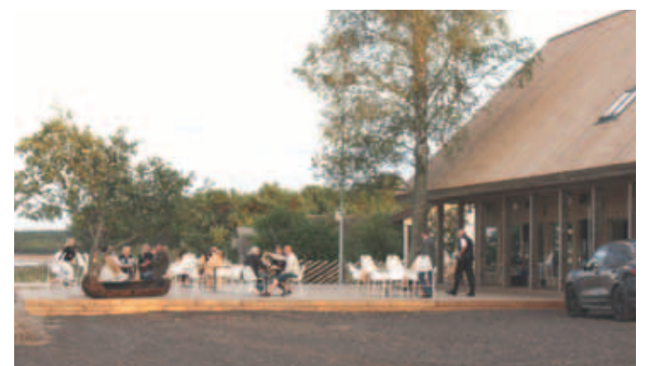
Neemes avati kalarestoran Ruhe