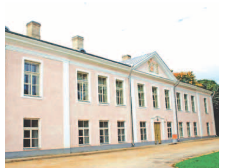
Kostivere mõisa fassaad sai uue näo