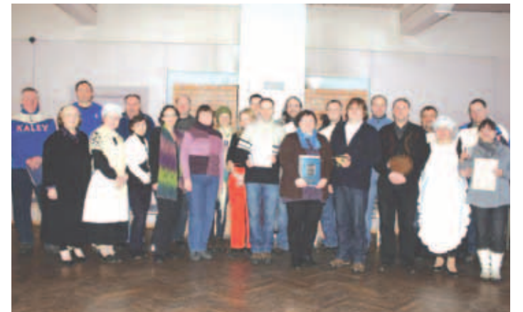
Jõelähtme valla 15. mälumänguturniir