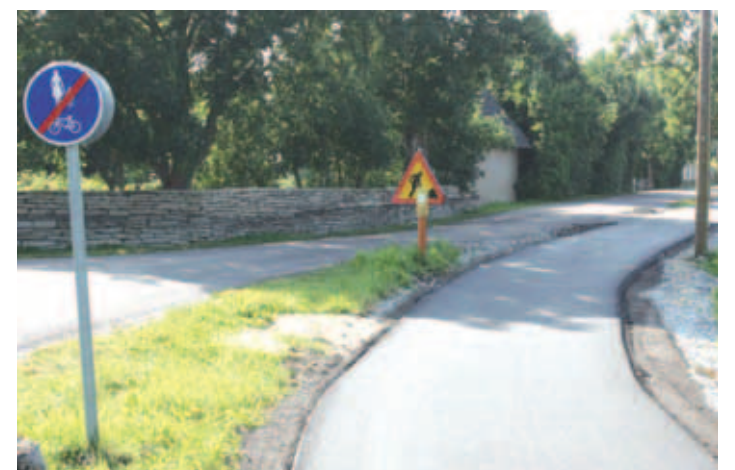
Liivamäe-Kuusiku tee vaheline kergliiklustee